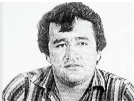
José Gonzalo Rodríguez Gacha

Fue el más rico y poderoso narcotraficante de Colombia, con una fortuna valuada entre los 5 y 10 mil millones de dólares. También ejerció como político y fue elegido Representante a la Cámara.