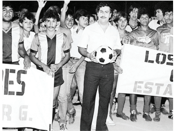
Uno de los eslóganes del cártel de Medellín, liderado por Pablo Escobar Gaviria, "El patrón", era "plata o plomo", aludiendo a los sobornos que realizaba en distintos ámbitos de la sociedad colombiana. Era aquello o la muerte.

- EE.UU. se gasta 15 billones de dólares anuales en la guerra contra las drogas y sólo un tercio de aquello en educación. Es importante atacar la oferta, pero tenemos que repensar la importancia del tratamiento y la educación. Me da vergüenza decir que mi país tiene el mayor apetito por las drogas ilegales. El presidente Felipe Calderón de México tiene razón cuando dice que somos parte del problema, por la demanda. Tenemos que mirar muy profundo y mirar quién está en nuestras cárceles, tenemos más gente en prisión que cualquier país. Hay muchos enfermos y personas que se han metido en este negocio. ¿Merecen ir a la cárcel? tal