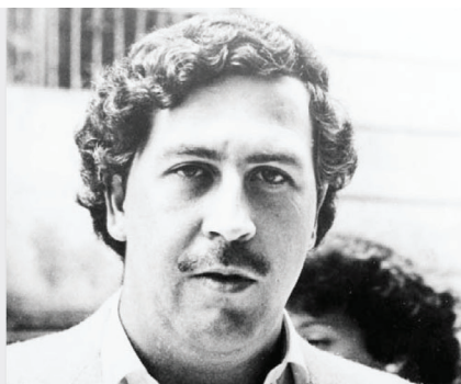
Pablo Escobar Gaviria

"One of the largest money laundering prosecutions in U.S. history." — Robert Mueller III, director of the FBI