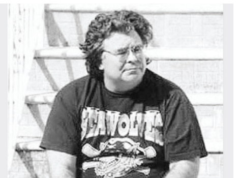
Carlos Enrique Lehder Rivas

Otro de los fundadores del Cártel y uno de los más sanguinarios. Contrató mercenarios británicos e israelíes y estuvo involucrado en la muerte del ministro de Justicia Rodrigo Lara Bonilla.